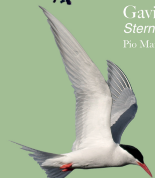
Gaviotín sudamericano Sterna hirundinacea