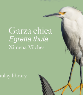
Garza chica Egretta thula Ximena Vilches