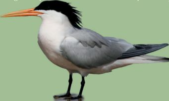
Gaviotín elegante Thalasseus elegans