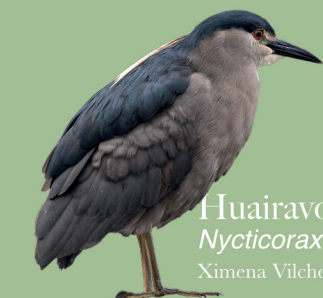
Huairavo Nycticorax nycticorax Ximena Vilches