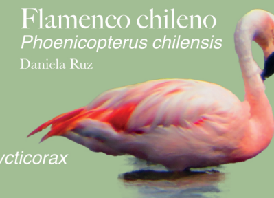
Flamenco chileno Phoenicopterus chilensis Daniela Ruz