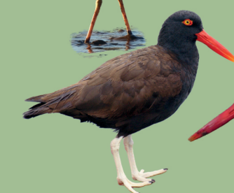
Pilpilén negro Haematopus ater