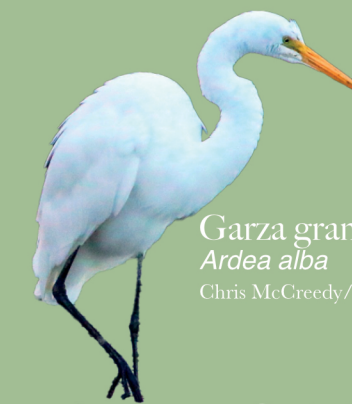
Garza grande Ardea alba