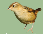
Becacina común Gallinago magellanica Sebastián Saiter